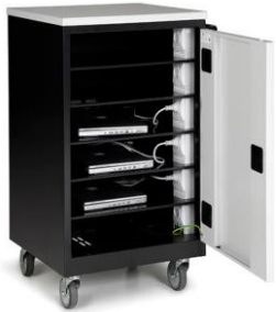
6 rums UDGAET